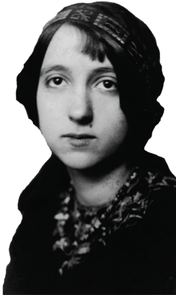
Mireille Havet en 1917

Les écrits de Mireille Havet seront retranscrits par Pierre Plateau et publiés en plusieurs volumes à partir de 2003 par Claire Paulhan.